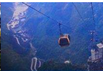
กระเช้าขึ้นเทียบเหมินซาบ