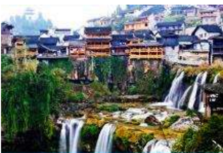
เมืองโบราณฟู่หวงจีน

https://www.cielchine.com/zhangjiajie-hotels/zui-xiang-xi-hotel/