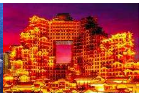
ตึกมหิศวรรษย์ 72 ชั้น